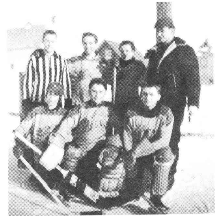
Une équipe de hockey en 1965.