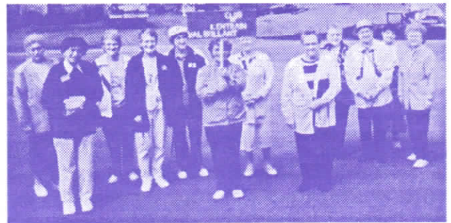
Marche du Club de l'entraide de Vie Active

Le 23 mai, même journée que le grand rassemblement de Viactive de Cabano, des membres ont clôturé les activités du mardi après-midi, par une marche symbolique dans le village de Val-Brillant. Soulignons, qu'il y a un relâche pendant la saison estivale et que le tout reprendra à l'automne, plus précisément en novembre.