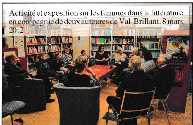
Activité et exposition sur les femmes dans la littérature en compagnie de deux auteures de Val-Brillant. 8 mars 2012