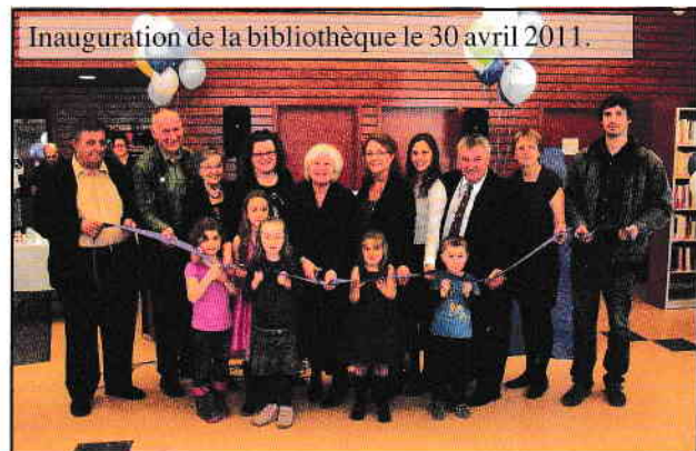
Inauguration de la bibliothèque le 30 avril 2011.