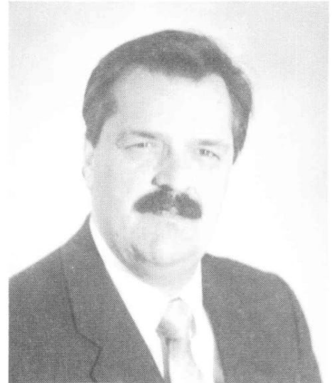
Marcel Auclair Marketing et Publicité.